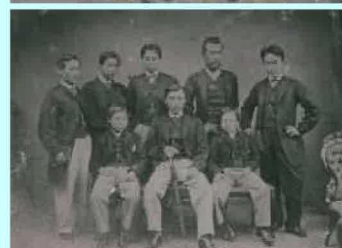
薩摩藩英国留学生