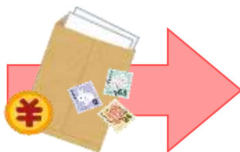
申込様式, 料金等を返送