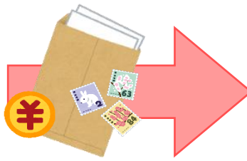
申請様式, 料金等を返送