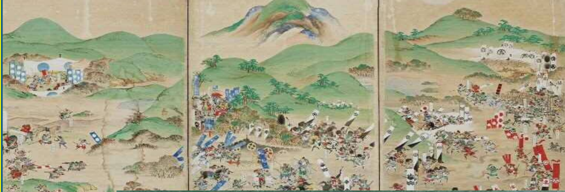
『関ヶ原合戦図屏風』(関ヶ原町歴史民俗資料館所蔵)