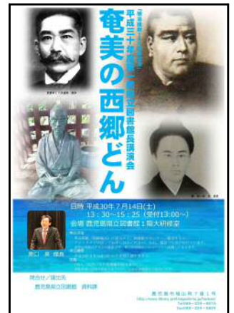
【館長講演会案内チラシ】