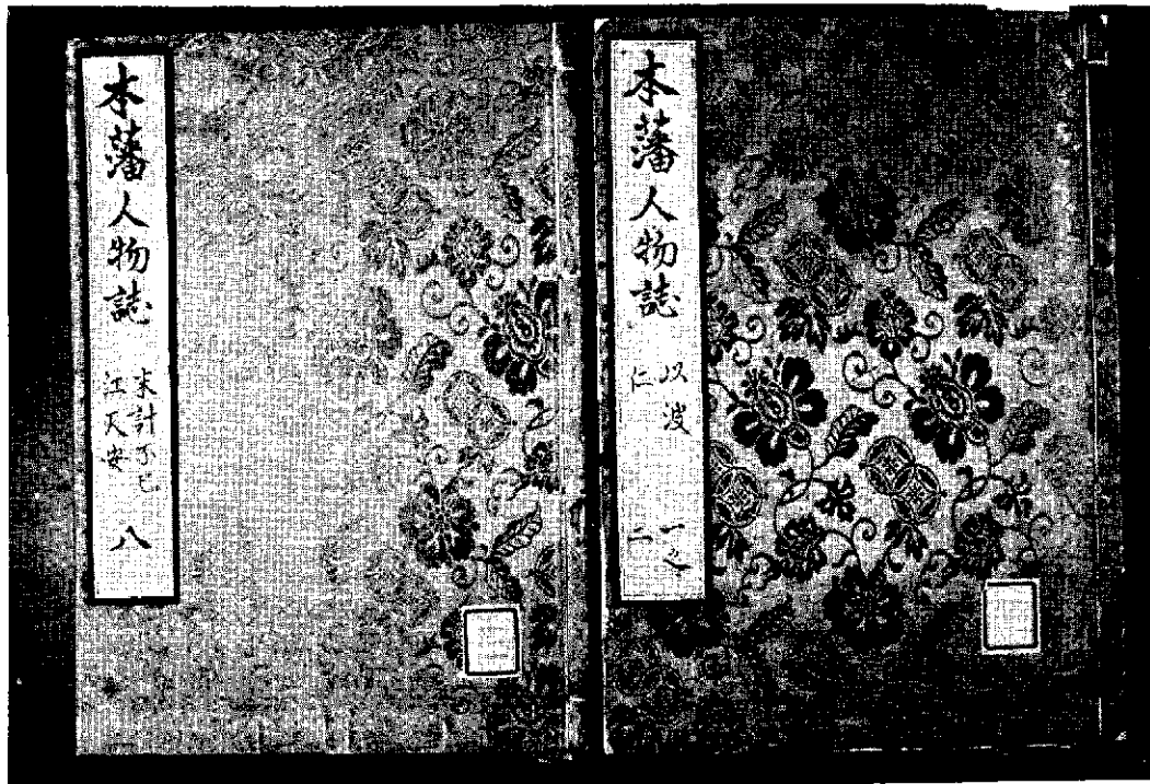
島津久光自筆本 (下里文庫) 鹿児島大学蔵