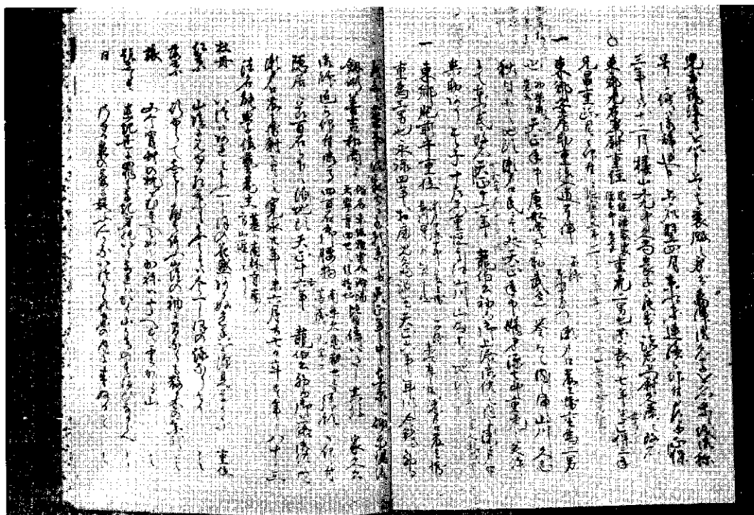
同 上 内容の一部