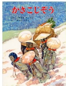
かさこじそう いわさき きょうこ ぶん あらい ごろう え ポプラ社