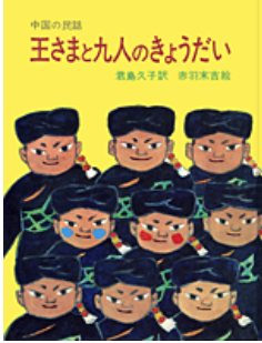
王さまと九人のきょうだい 君島 久子 訳 赤羽 末吉 絵 岩波書店