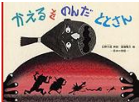
かえるをのんだととさん 日野 十成 再話 斎藤 隆夫 絵 福音館書店