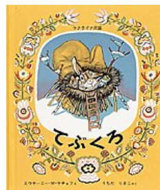
てぶくろ Iガ -ニ・M・ヲヲ え うちだ りさこ やく 福音館書店