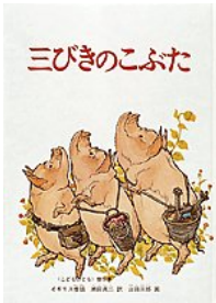
三びきのこぶた 瀬田 貞二 やく 山田 三郎 え 福音館書店