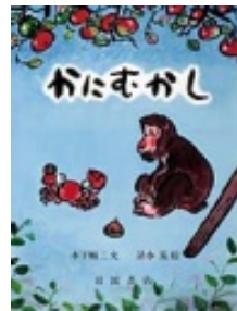
かにむかし 木下 順二 文 清水 崑 絵 岩波書店