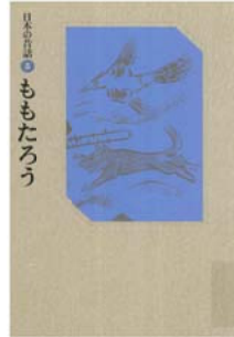
日本の昔話 3 ももたろう おざわ としお 再話 赤羽 末吉 画 福音館書店