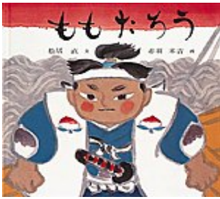
ももたろう 松居 直 文 赤羽 末吉 画 福音館書店