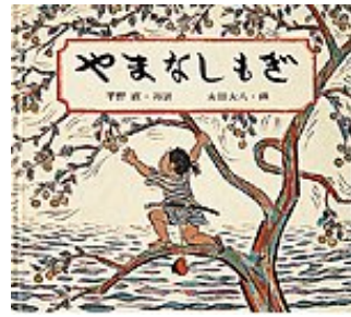
やまなしもぎ 平野 直 再話 太田 大八 画 福音館書店