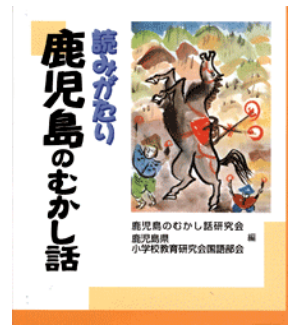
読みがたり鹿児島のむかし話 鹿児島のむかし話研究会 編 鹿児島県小学校教育研究会 国語部会 編 日本標準