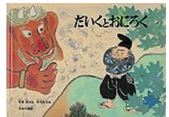
だいくとおにろく 松居 直 再話 赤羽 末吉 画 福音館書店