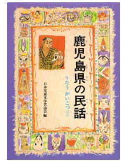
鹿児島の民話 日本児童文学者協会 編 偕成社