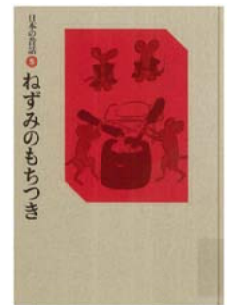
日本の昔話 5 ねずみのもちつき おざわ としお 再話 赤羽 末吉 画 福音館書店