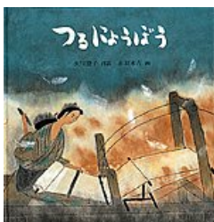
つるようぼう 矢川 澄子 再話 赤羽 末吉 画 福音館書店