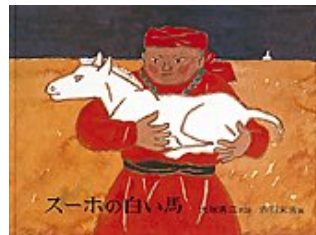
スーホの白い馬 大塚 勇三 再話 赤羽 末吉 画 福音館書店