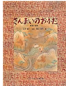
さんまいのおふた 水沢 謙一 再話 梶山 俊夫 画 福音館書店