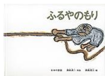
ふるやのもり 瀬田 貞二 再話 田島 征三 絵 福音館書店