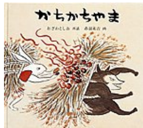
かちかちやま おざわ としお 再話 赤羽 末吉 画 福音館書店