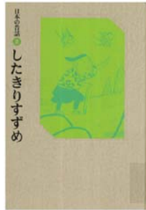
日本の昔話 2 したきりすすめ おざわ としお 再話 赤羽 末吉 画 福音館書店