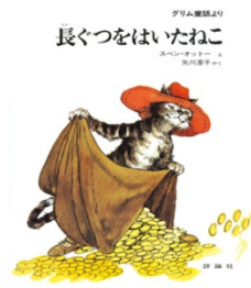
長ぐつをはいたねこ グリム童話より スベン・オッター え 矢川 澄子 やく 評論社