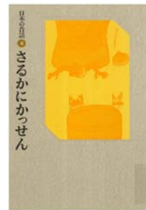
日本の昔話 4 さるかにかっせん おざわ としお 再話 赤羽 末吉 画 福音館書店