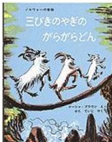
三びきのやぎの からがらどん マツ・アラウ え せた ていじ やく 福音館書店