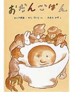
おだんごぼん せた ていじ やく わきた かず え 福音館書店