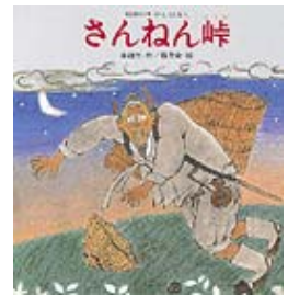
さんねん峠 李 錦玉 作 朴 民宜 絵 岩崎書店