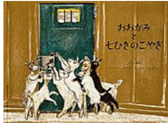
おおかみと七ひきのこやぎ フェリクス・ホフマン え せた ていじ やく 福音館書店