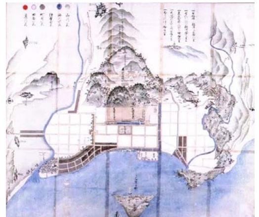
【薩藩御城下絵図(鹿児島)】