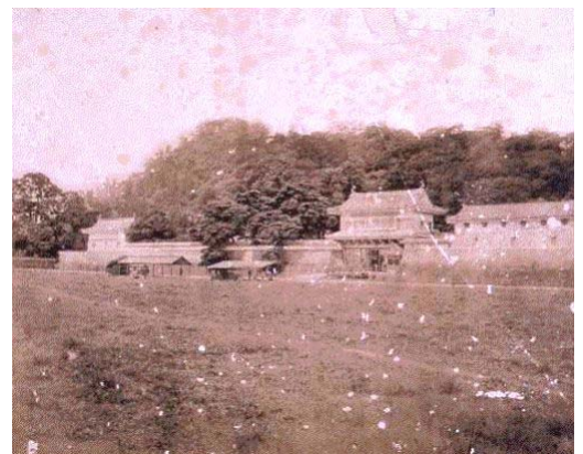
【島津御本丸前面景(写真)】