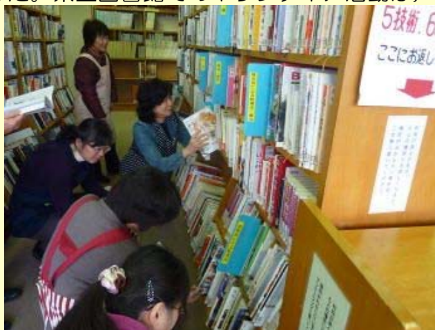
(整架・配架の実習)

県立図書館では、ボランティアの方々から、書架の整理、破本の修理など大きな力添えをいただいています。